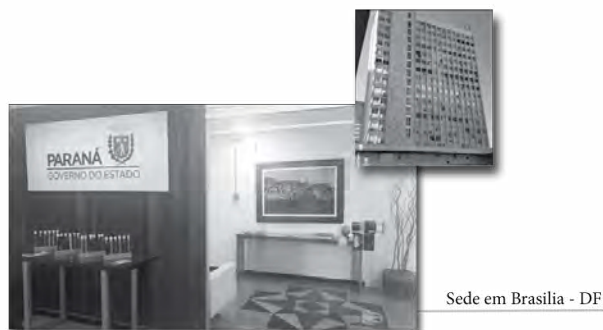
Sede em Brasília - DF